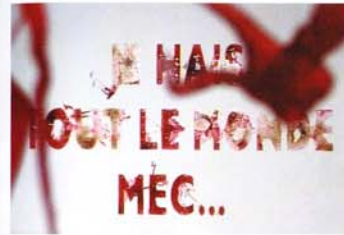
Stéphane Sautour/Galerie Loevenbruck.